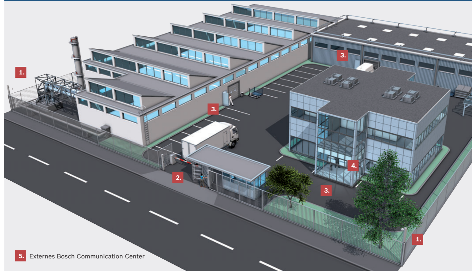
5. Externes Bosch Communication Center