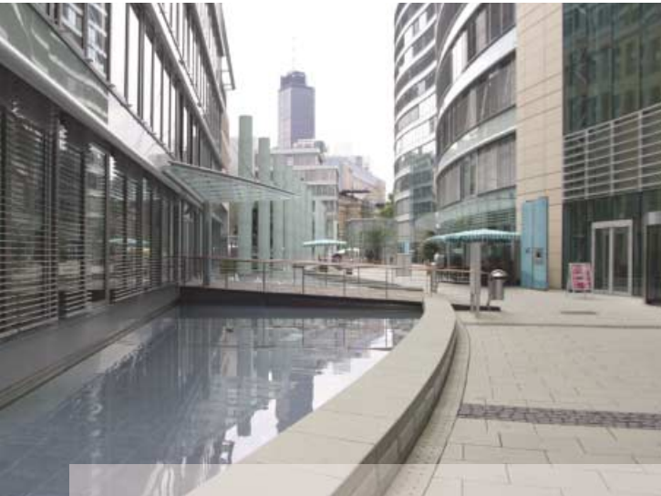
▲ Der Innenhof der „Frankfurter Welle“

Funktionalität und fließende Harmonie – die „Frankfurter Welle“ repräsentiert die perfekte Synthese aus Geschäftsräumen und Wohnkultur auf höchstem Niveau. Mit ihrem wellenförmigen Baukörper passt sie sich in ihr Umfeld ein und sorgt für einen „fließenden“ Übergang zwischen der Hochhausbebauung des Bankenviertels, der Alten Oper und der nördlichen Stadtteilstruktur Frankfurts. Das CityQuartier „Frankfurter Welle“ vereint fünf moderne Neubauten und einen historischen, vollständig sanierten Altbau zu einem attraktiven Anziehungspunkt, an dem Arbeiten und Leben fließend ineinander übergehen.